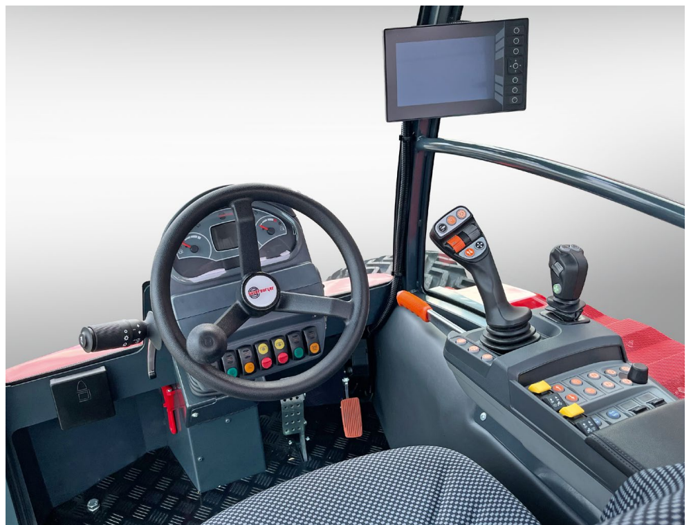
Kabine Grip4-70 Premium

Auf dem großen 7" Farbdisplay werden alle für den Fahrer wichtigen Informationen zu Betriebszuständen des Fahrzeuges und verschiedenste Einstellungen zu Lenk- und Fahrmodis übersichtlich angezeigt. Über die in der Armlehne sich befindenden Schalter kann der Fahrer einfach und sicher die Auswahl der Fahr- und Lenkmodis treffen, sowie u.a. Einstellungen zu Fahrgeschwindigkeit, Motor und Zapfwendrehzahl vornehmen.